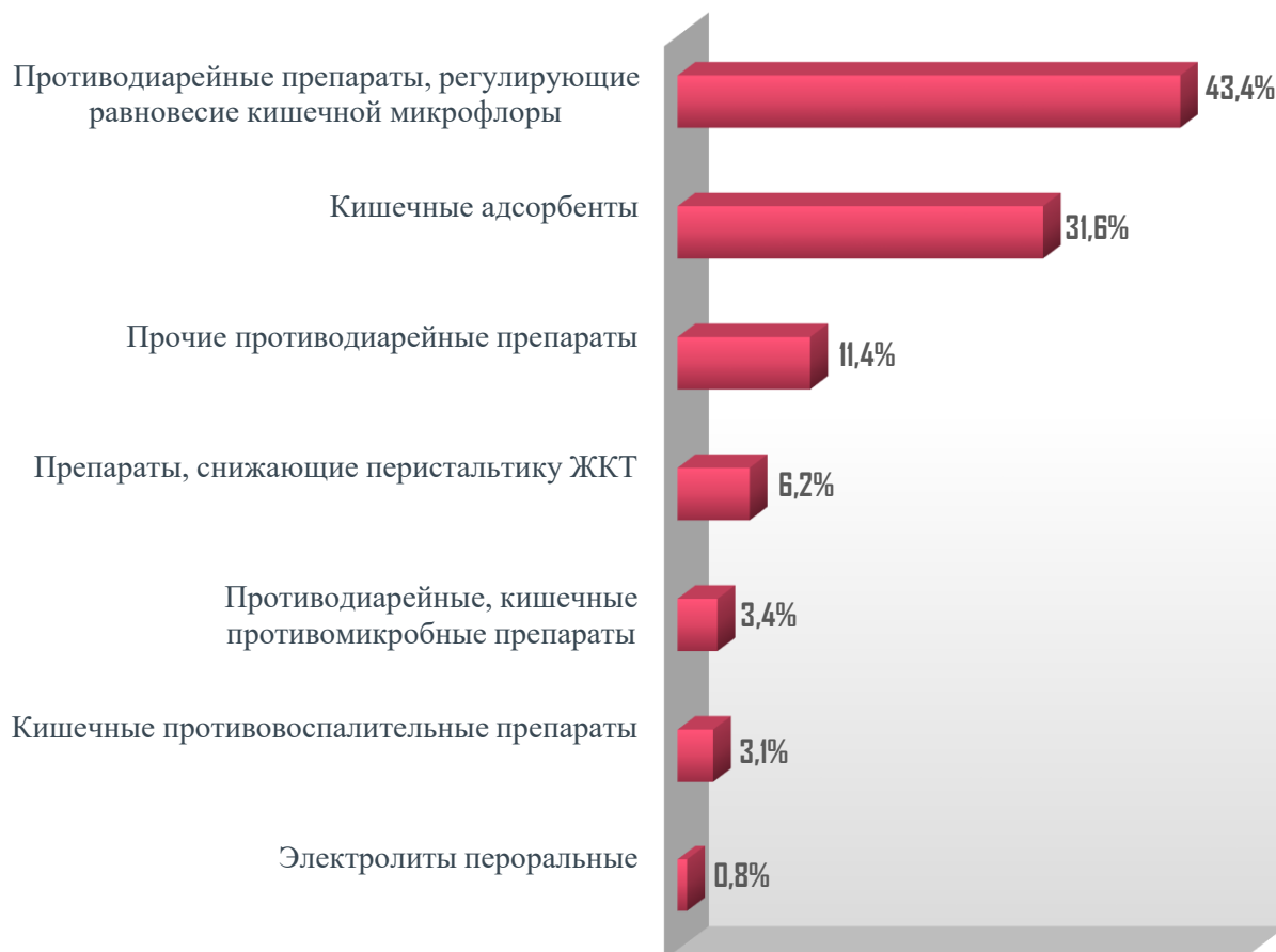
Доля препаратов группы EphMRA A7 по итогам YTD'авг. 2017 года в стоимостном выражении (%)

Рис. 2